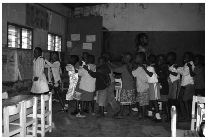
Jonge kinderen in 'optocht' door de klas

De vaardigheden die hiervoor nodig zijn worden in de eigen schoollokaaltjes en werkplaatsen bijgebracht. Pandipieri heeft hiervoor een aantal docenten in dienst. Pandipieri leidt mensen op tot timmerman, automonteur, kledingmaker en -hersteller, verpleegster, huishoudelijk medewerkster. Bovendien heeft Pandipieri voor de creatieve kinderen een heuse Kunstacademie. De inrichting van de werkplaatsen is over het algemeen beperkt. Dit vraagt bij veel activiteiten om een groot improvisatievermogen.